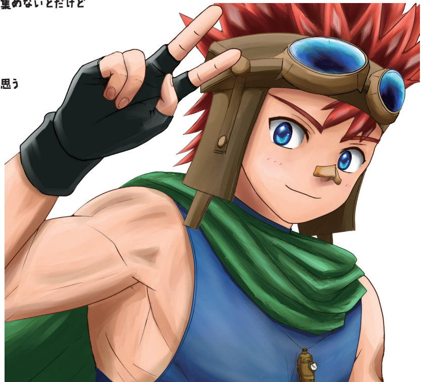
アイコン用新規イラスト

はるか紀元前バビロニアの時代では マナエネルギーがあったんじゃないかな 空も飛べただろうし 記憶の集積 共有もできた でもそれが有限資源だと気づかなかったから 現代には何も残っていないのかも そうかんがえると ロマンあるよな