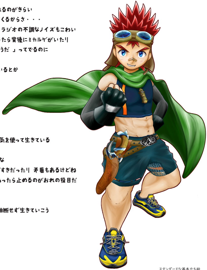
スタンダードな基本立ち絵

おれは気配に敏感すぎるのかもしれない とはいえ、生き残るためには必要だったからさ... 不審な物音、視線や気配、違和感、いまだにそういうものに気を使って生きている 物語の主人公が凡ミスで死ぬわけにはいかねーんだよな もう少し気楽に生きていいよっていわれるけど、むずかしいな その割には、危ない乗り物変頭のバイクに乗せてもらうのが好きだったり、矛盾もあるけどね まあ、うちのーちゃんのことは信頼してるから、違和感があったら止めるのがおれの役目だ みんなはもっとじぶんのことだけみて、生きてほしいと思うよ おれみたいに息苦しく生きる必要なんてないぜ だけど、みえない危険も、だまされることも、たくさんある、油断せず生きていこう