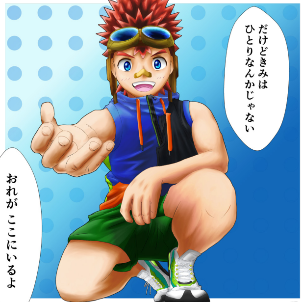
「哀しみの向こう側」にいるイマジナリーフレンド

自分も髪の色を紅に染めて仕事をさせてもらっていますが、みんなにいい顔されるとは思っていません(特にお客様)、そこは仕事とは別でお願いしてやらせていただいています。職場で赤髪もいいねってほめてもらいたいとか そういう必要はないんですよね。なんだ、自分もそういうつもりなんだという気付き。大なり小なり、みんなそういうこだわりを持っているんです。そこを尊重しようとかあんまりどうでもよくて、仕事の遂行に支障をきたさなければよくないですか? と。冷たい人と分かり合うのなんて無理難題すぎます。冷たすぎて職場の空気が悪くなり、業務に支障をきたすというのならちょっとまた考えないですけどね、とか。いろんな人に伝えたくなるような素敵なセミナーでした。興味があったら検索してみてください。頭が少し柔らかくなるかもしれませんよ。